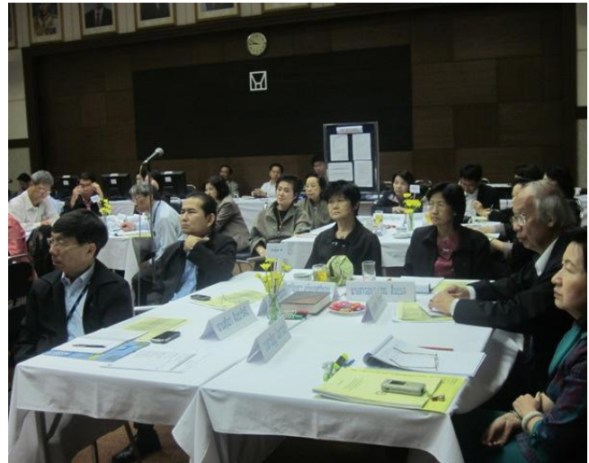
21-22 มิถุนายน 2555 บรรยายภาคของโครงการ พัฒนาผู้บริหารของกระทรวงมหาดไทย หลักสูตร การพัฒนาผู้บริหารระดับสูง (Executive Development Program for Top Team) รุ่นที่1 ครั้งที่ 4 และ 5