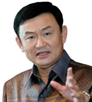
ทักษิณ ชินวัตร