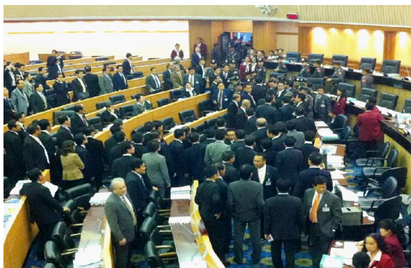
ภาพเหตุการณ์ความรุนแรงในสภาผู้แทนราษฎร

และสุดท้ายคือ ส.ส.ฝ่ายรัฐบาลที่ยกมือเป็นฝักถั่วโดยไม่ใช้สติปัญญา ทำให้ผมมีความสมเพชในคณะสภาผู้แทนของเราว่าทำเพื่อใคร?