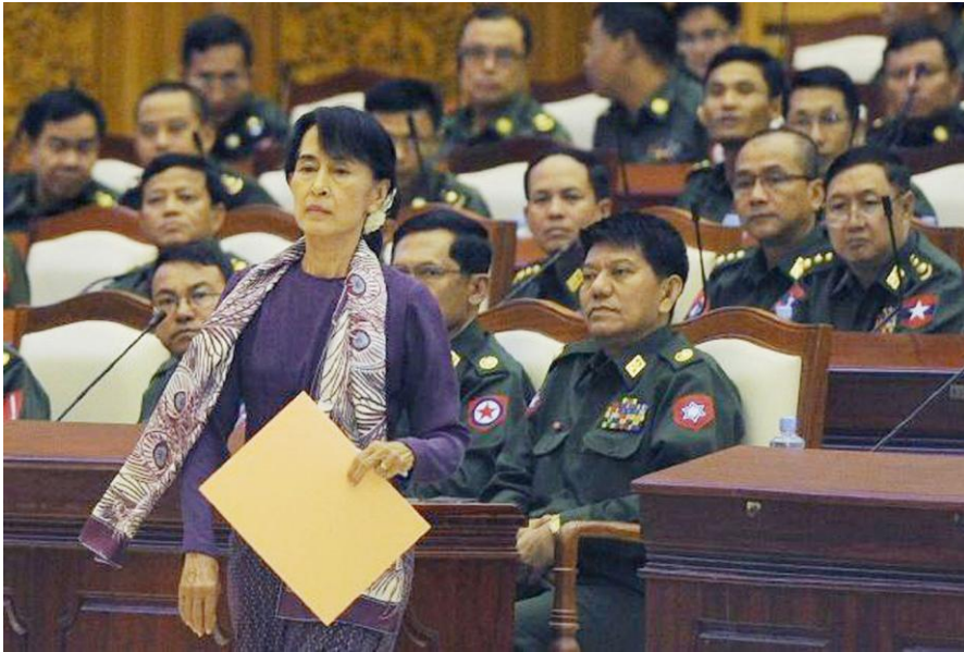
บรรยากาศ องซานซูจี มาเยือนแรงงานชาวพม่าในประเทศไทย

อีกเหตุการณ์ก็คือ การเดินทางมาประเทศไทยขององซาน ซูจี ซึ่งเป็นการเดินทางครั้งแรกนอกประเทศ ทำให้คนไทยได้คิดเปรียบเทียบระหว่างองซานกับคุณยิ่งลักษณ์ว่ามีภาวะผู้นำแตกต่างกันอย่างไร?