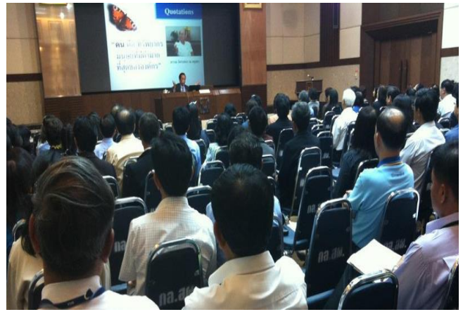
8 มิถุนายน 2555 ศ.ดร.จิระ หงส์ลดาธรมภ์ มาบรรยายในโครงการพัฒนาผู้บริหารระดับสูงของการเคหะแห่งชาติ 2 รุ่น รวม 73 คน

ติดตามกิจกรรมดีๆ มีความรู้กับพวกเราได้ใหม่ในสัปดาห์ ... สวัสดีค่ะ