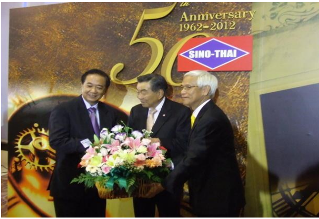
7 มิถุนายน 2555 ศ.ดร.จิระ หงส์ลดาธรมภ์ ร่วมแสดงความยินดีในงาน Sit-down Dinner ครอบรอบ 50 ปี บริษัทซีโนไทย